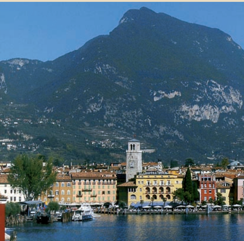
Veduta di Riva del Garda dal lago View of Riva del Garda from the lake