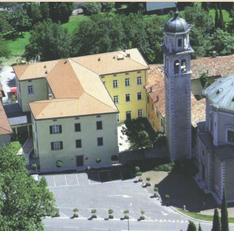
Veduta del Conservatorio di Musica "F. A. Bonporti" di Riva del Garda View of the Conservatorio di Musica "F. A. Bonporti" - Riva del Garda